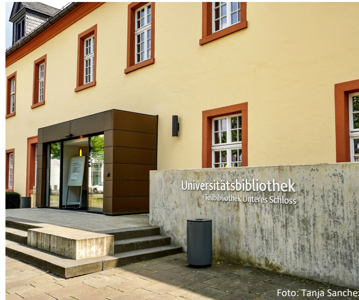
Unsere gut ausgestattete Bibliothek