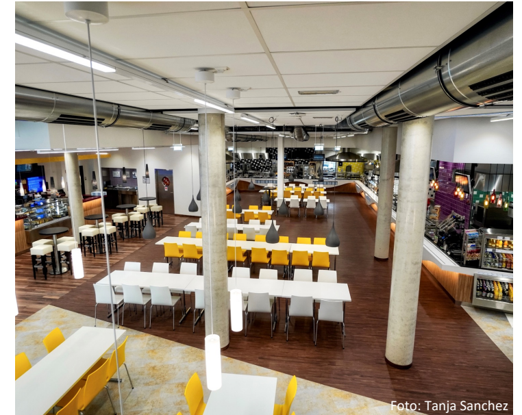
Unsere „leckere“ Mensa und Cafeteria