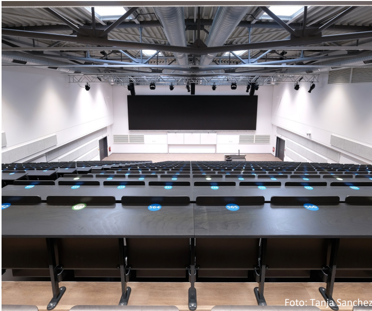
Moderneste Hörsäle und Seminarräume