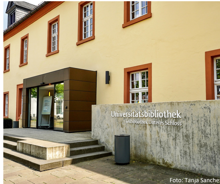
Unsere gut ausgestattete Bibliothek